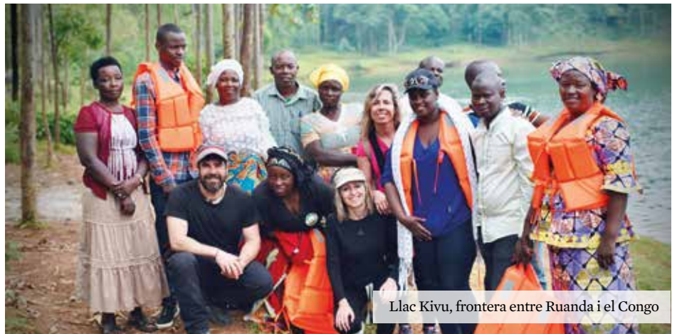
Llac Kivu, frontera entre Ruanda i el Congo

L'Ajuntament de Sant Just Desvern, amb la seva iniciativa de suport a la creació artística, mostra com la cultura pot ser motor de canvi, promovent la memòria històrica i els drets humans a través de l'art.