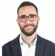
Just Fosalva i Sanjuan Grup Municipal de Sant Just En Comú

D'aquí a poques setmanes comença un dels moments més importants per a moltes famílies de Sant Just, el moment de triar centre educatiu, tant de primària, com de secundària.